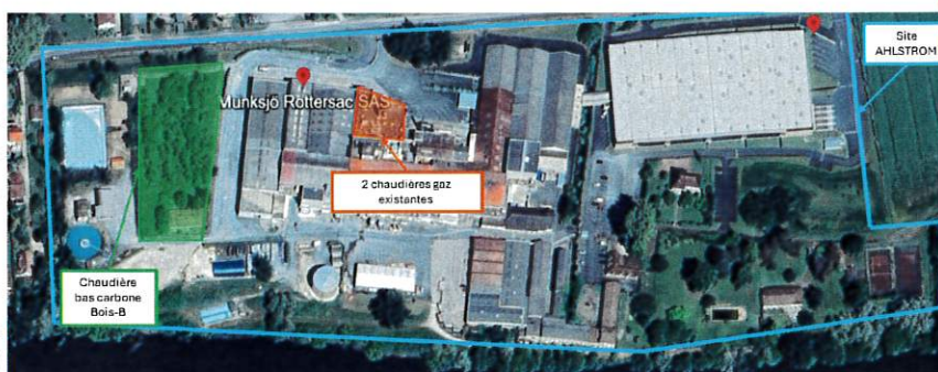
Vue aérienne du site AHLSTROM et future implantation

https://www.dordogne.gouv.fr/Actions-de-l-Etat/Environnement-Eau-Biodiversite-Risques/Participation-du-public/